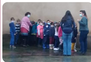
Les enfants, rassemblés à proximité de l'église !